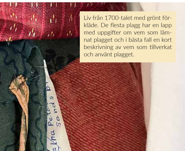
Liv från 1700-talet med grönt förkläde. De flesta plagg har en lapp med uppgifter om vem som lämnat plagget och i bästa fall en kort beskrivning av vem som tillverkat och använt plagget.