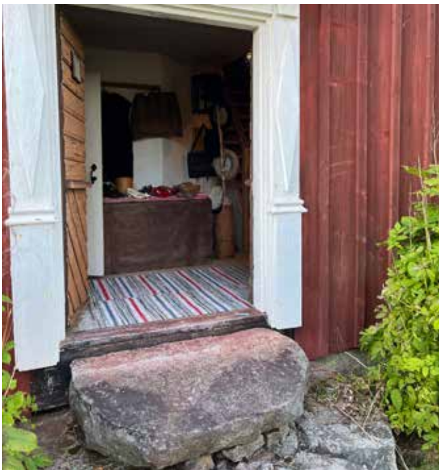
Välkommen till Hoppets hembygdsgård!