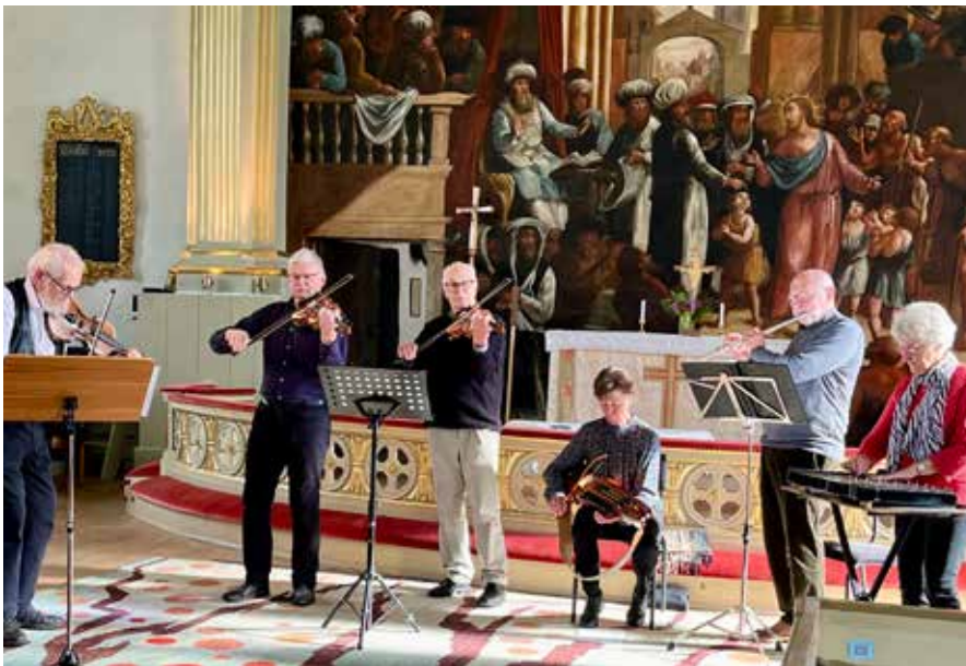
Virestads folkdanslag bjöd på musik i kyrkan.

Text: Tomas Olofsson