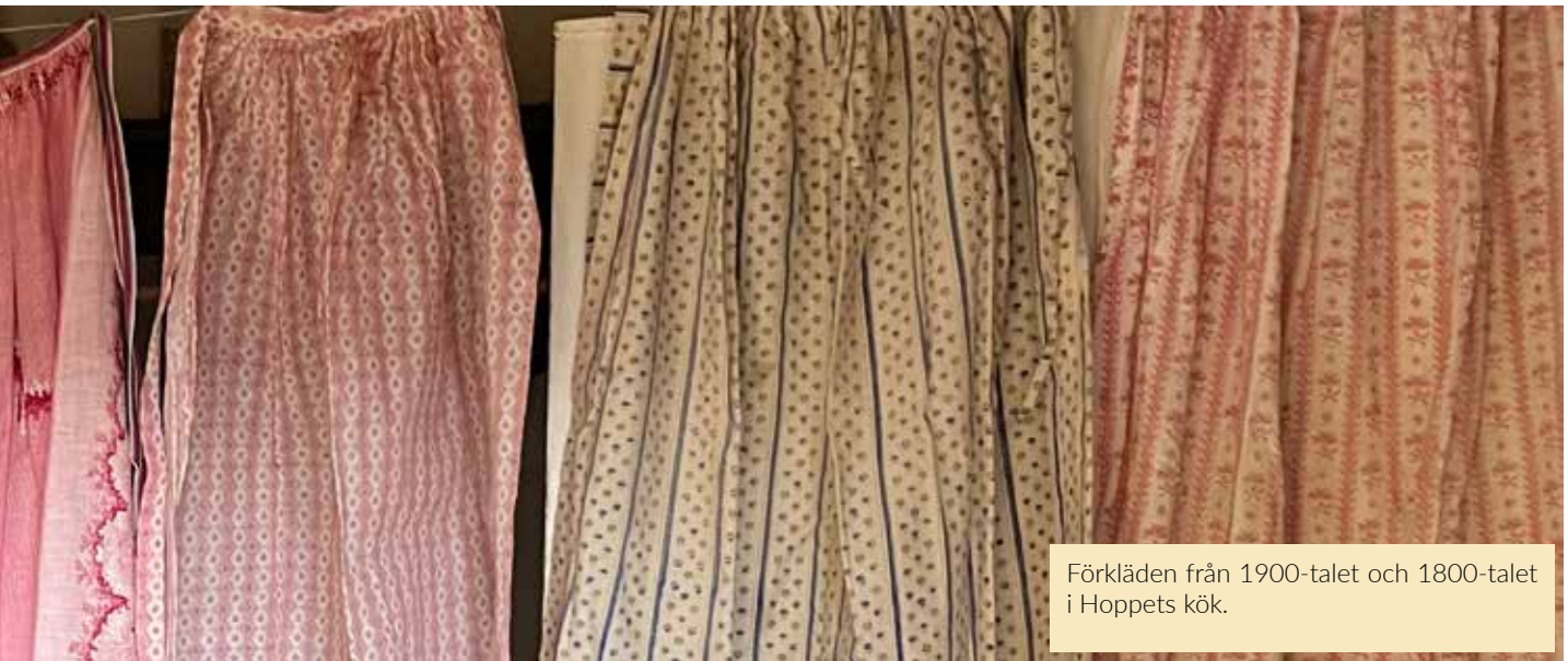
Förkläden från 1900-talet och 1800-talet i Hoppets kök.