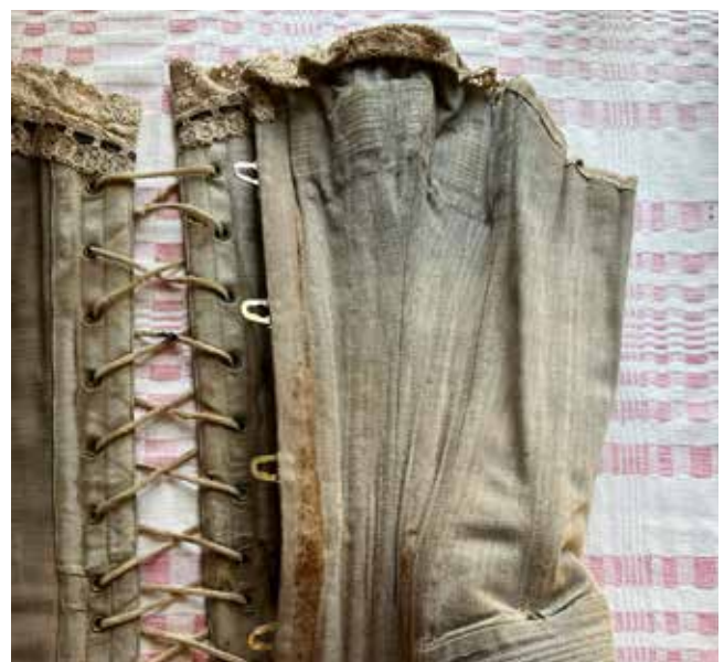
Korsett från en av byråådorna