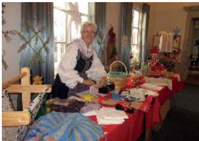
Slöjdlotteriet från julmarknaden.