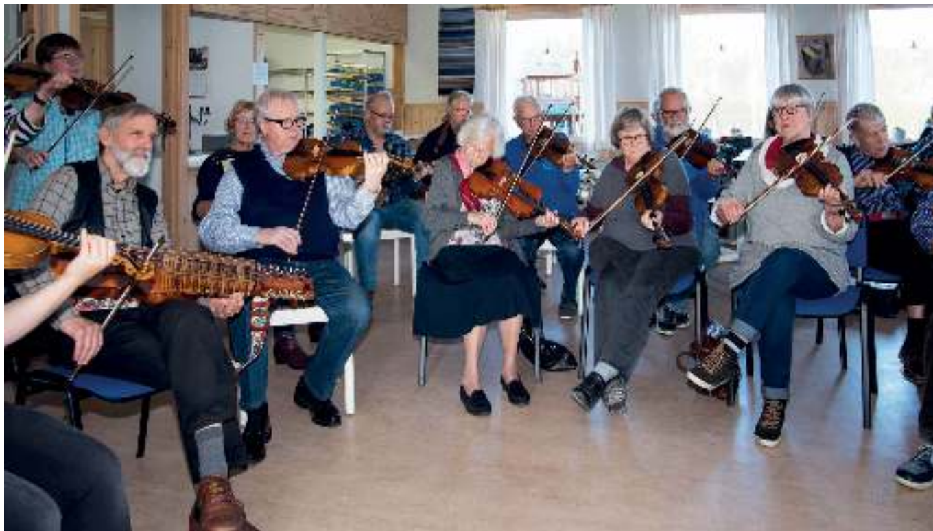
Spelträff i Torpa Bystuga i oktober 2017 Vad kan vi njuta av mera än 42 spelsugna, trevliga och glada spelmän från södra Sverige?

Folkmusiken ger så mycket av livslust och samspel som är svårt att förklara.