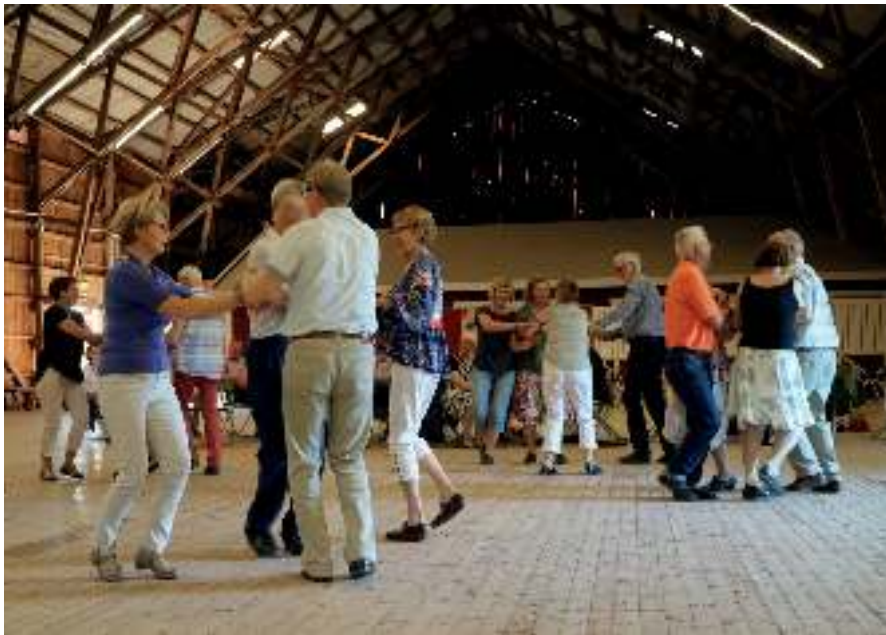
Dans på Skälby loge.