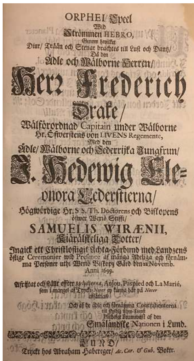
Titelsidan på bröllopstrycket till Drake och Cederstierna i Växjö 1699.

”A frytat och ställt effter Melodierna, Anjou, Paspied och La Marié, som i mangel af Trycke-Noter ey kunna