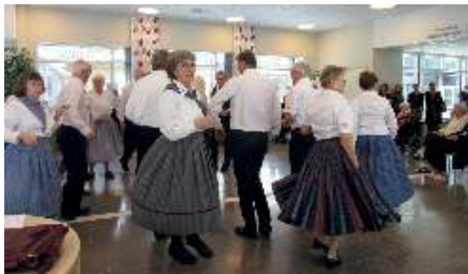
Uppvisning på ett äldreboende.

En duktig festkommitté ser till att vi får god mat på våra fester. Vi har alltid vår- och höstfest. Oftast är all mat hemlagad. Lagets spelmän spelar till dans på festerna som samlar många medlemmar. Vår julfest börjar med Kalmarbyggens Lucia och slutar först när vi fått gröt och