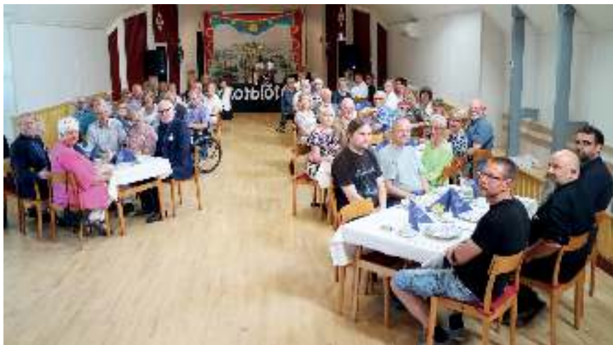
I väntan på middag och musik av Rotblöta.