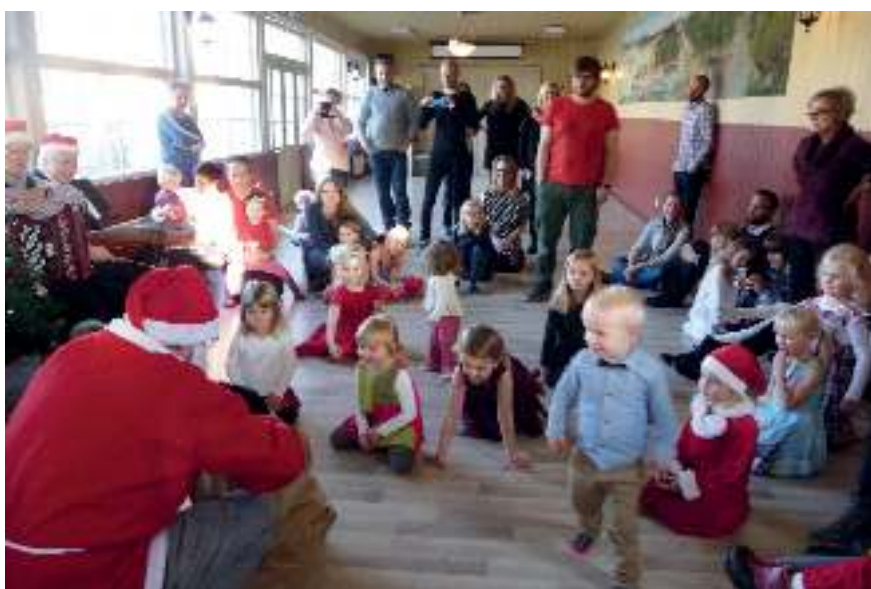
Julfest för barn och vuxna är ett uppskattat inslag.