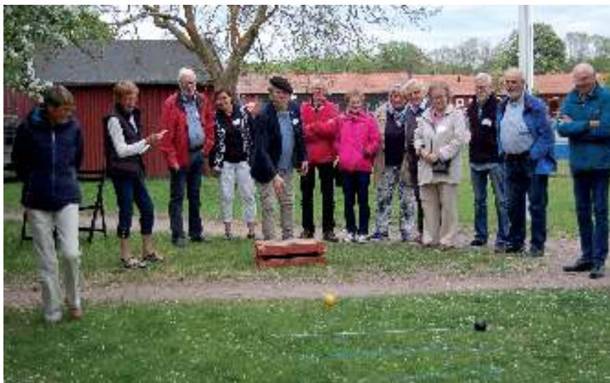
Gäster och värdar tävlar i att kasta klot.

På fredagen utforskade gäster och värdar norra Öland per buss med stopp vid bl.a. Källa Ödekyrka, Lilla Horns blomsterängar och Skurkvarnen vid Jordhamn. Lunchen bestod av picnic på kroppkakor med tillbehör, som intogs med vidunderlig utsikt över Kalmarsund och Blå Jungfrun från höjderna vid Jordhamn. På kvällen bjöds festmiddag på Skälby med allsång och tal med återblickar på tidigare träffar. Folkmusikgruppen Rotblöta från Nybro stod för underhållningen. Sen blev