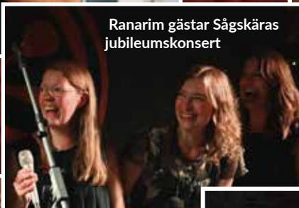
Ranarim gästar Sågskäras jubileumskonsert