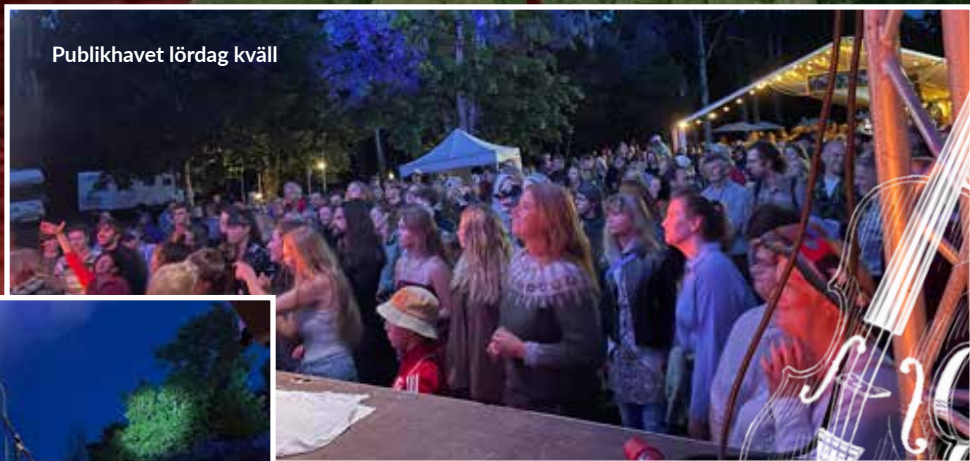
Publikhavet lördag kväll