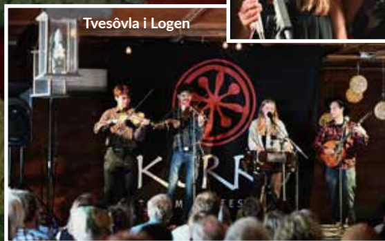
Tvesövla i Logen