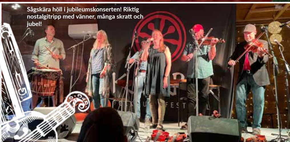
Sågskära höll i jubileumskonserten! Riktig nostalgitripp med vänner, många skratt och jubel!

Text: Britt-Marie Arvidsson