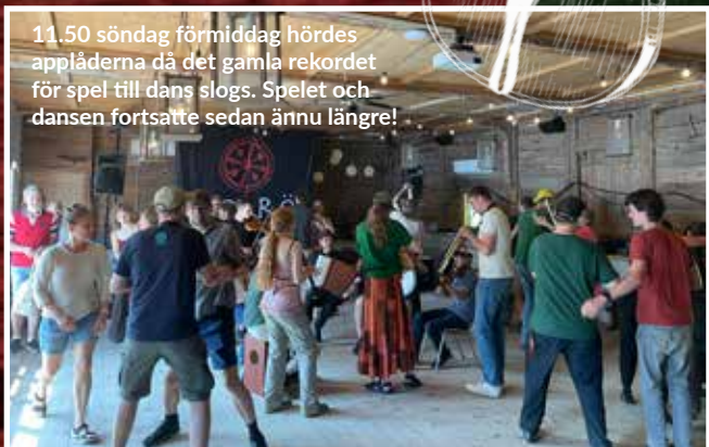
11.50 söndag förmiddag hördes applåderna då det gamla rekordet för spel till dans slogs. Spelet och dansen fortsatte sedan ännu längre!