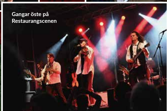
Gangar öste på Restaurangscenen