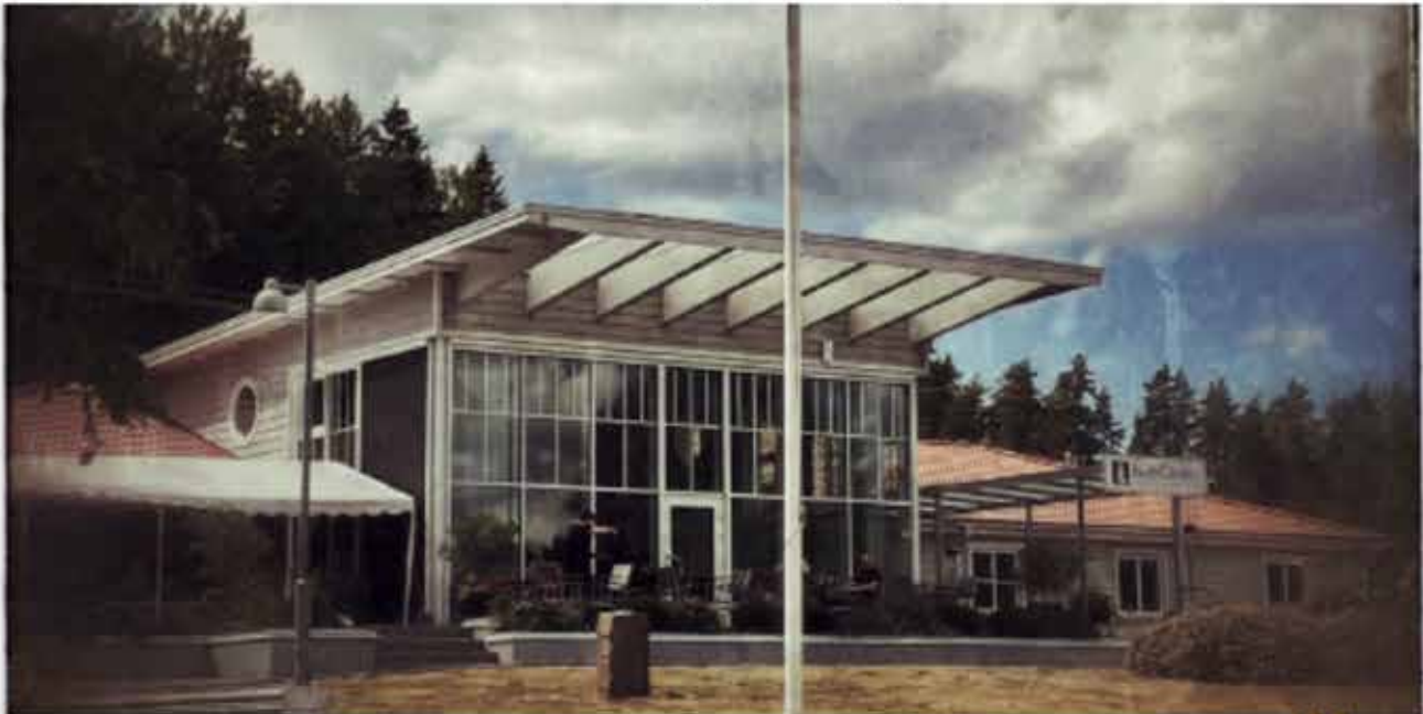
BauerGården, Bunn, strax söder Gränna, Småland