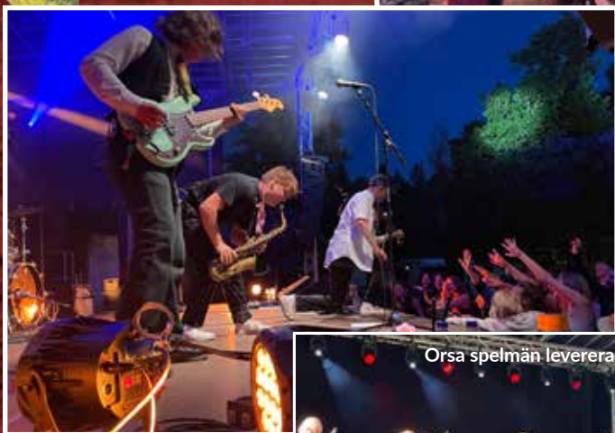
Orsa spelmän levererade!