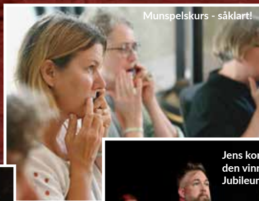
Munspelskurs - såklart!