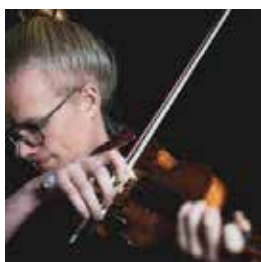
Gusten Brodin Barn- och ungdomsverksamhet Smålands Spelmansförbund

Men inte för någon annan – utan för oss själva.