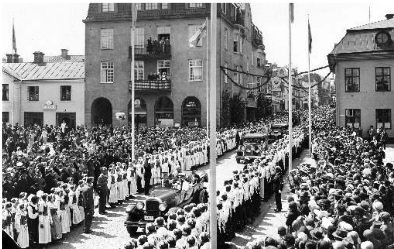
Vid Gustav V:s besök i Västervik 1933 kantades Storgatan av 600 kvinnor i nysyddas Tjustdräkter.