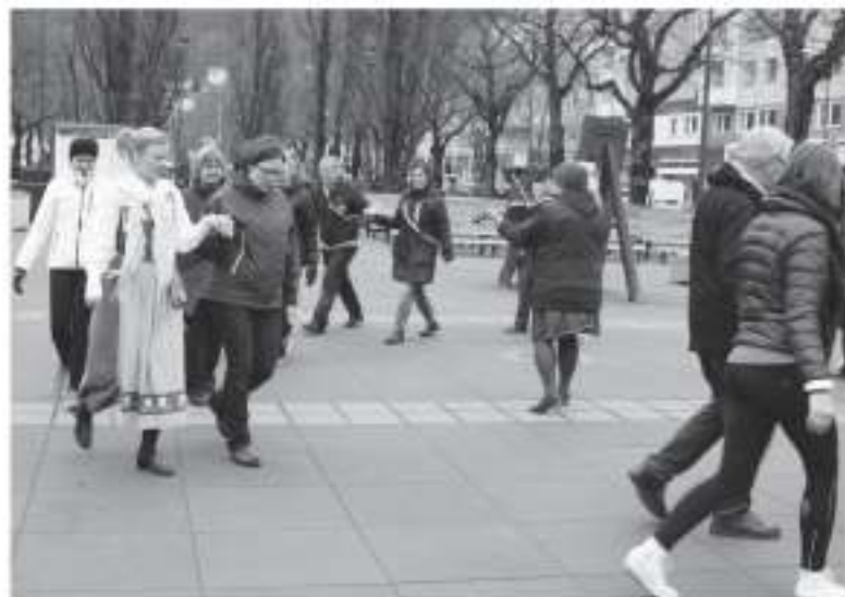
Möhippa i Jönköpings centrum.