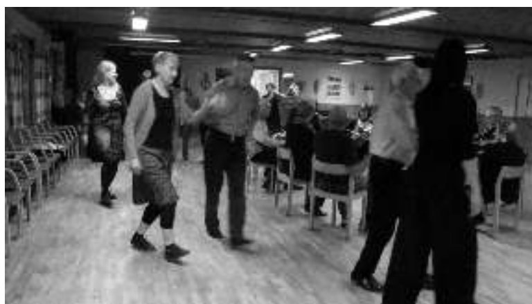
Dans- och spelkväll.