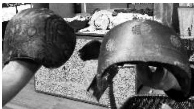
Två bindmössor från olika tidsperioder.

Det finns c:a 15 olika mönster till tyllstycken och någon hade hört, att man därigenom kunde visa vilken socken man kom ifrån. (Det finns ett 30-tal hembygdsföreningar, men alla är inte socknar).