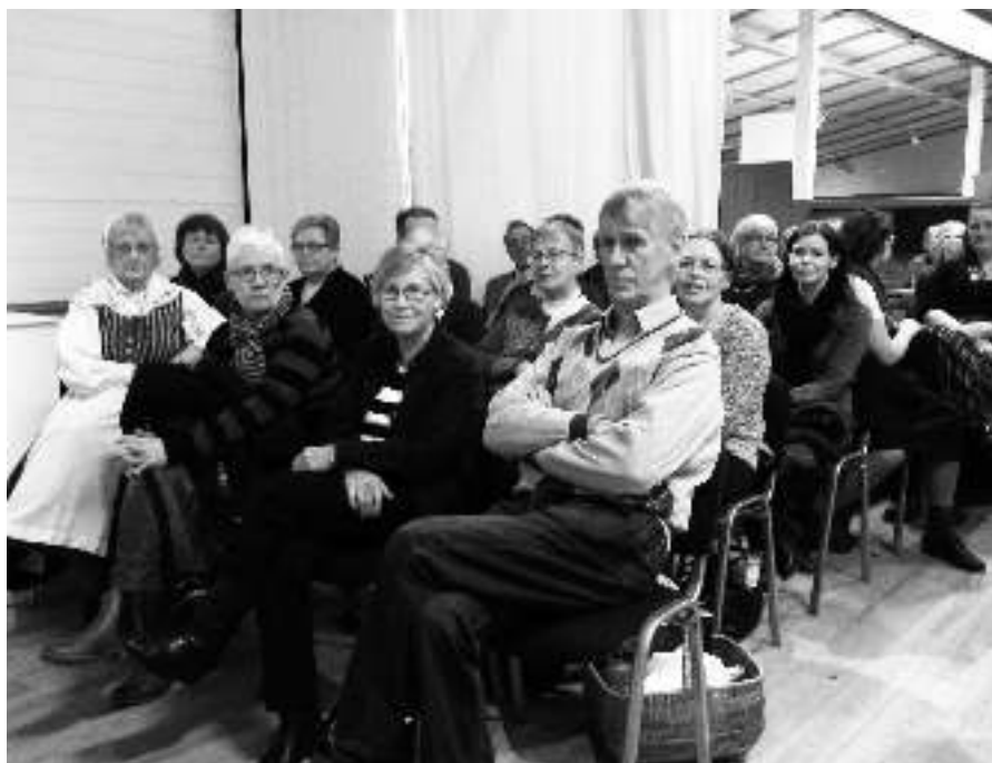
Bland åhörarna fanns flera som var klädda i Tjustdräkt.