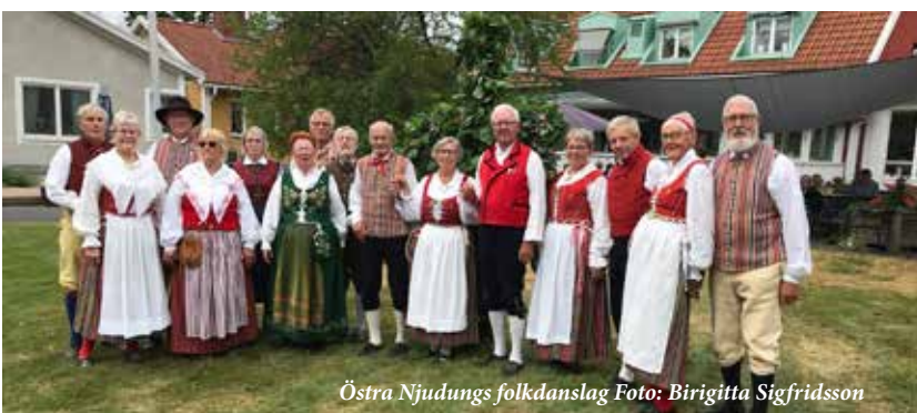
Östra Njudungs folkdanslag