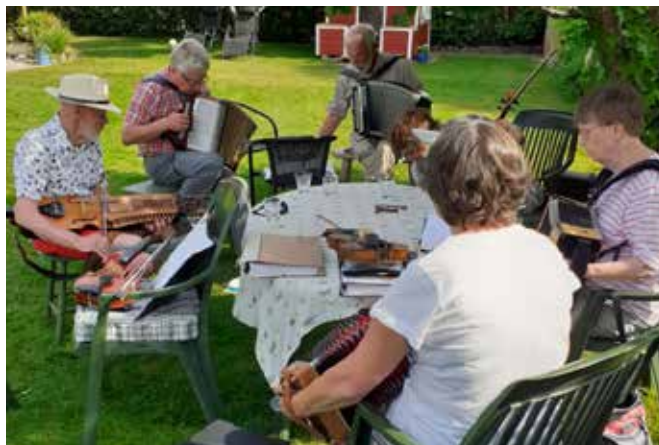
NU: Årsmöte med spel i trädgården.