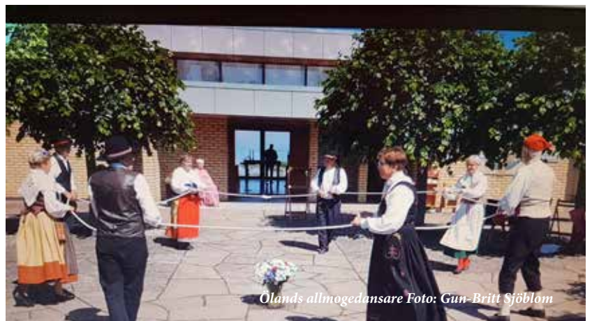
Olands allmogedansare